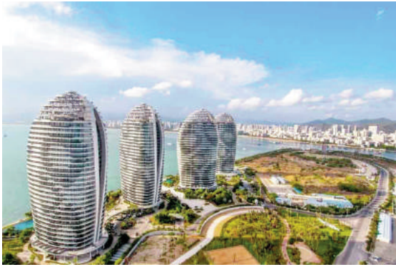
Đảo nhân tạo Phoenix Island, thành phố Tam Á, Trung Quốc

nữa tại các lãnh thổ nhân tạo trên sông Dương Tử (gần Thượng Hải), các đô thị đều có thể tự bảo đảm nguồn năng lượng sinh học cho mình. Theo dự kiến, cho tới năm 2050, toàn bộ hạ tầng sinh thái cho các lãnh thổ nhân tạo rộng hơn 8600 ha này sẽ được hoàn thiện.