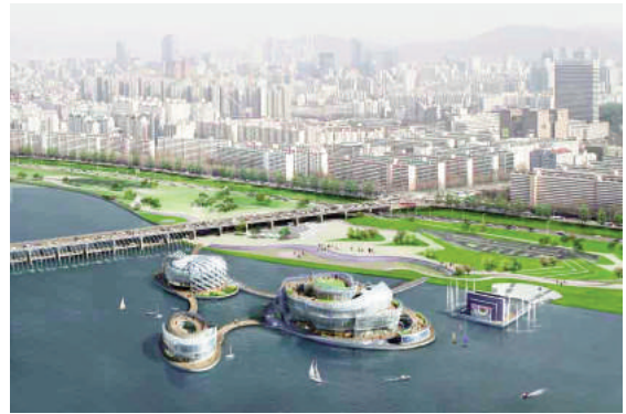
Đảo nổi Sevit, Hàn Quốc

Biến đổi khí hậu luôn kéo theo lũ lụt và bão, với hậu quả là các vùng duyên hải của nhiều quốc gia đang có nguy cơ biến mất. Một nửa dân số Mỹ sinh sống tại các khu vực ven biển; còn tới năm 2025 ước tính sẽ có khoảng 2,75 tỷ người trên toàn thế giới sống gần biển. Do mực nước biển toàn cầu dâng cao, lũ lụt theo mùa và tần suất hoạt động của các cơn bão gia