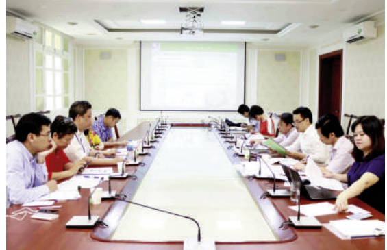
Toàn cảnh buổi nghiệm thu lớn, tải trọng trục xe đặc biệt lớn.

Phần đỉnh hố ga và phần đỉnh hố thu quy định trong 2 tiêu chuẩn này được sử dụng tại các khu vực: Dành riêng cho người đi bộ và xe đạp, bãi đỗ xe hoặc tầng đỗ ô tô, khu vực lề đường được đo từ cạnh lề đường, kéo dài tối đa 0,5m về phía đường xe chạy và tối đa 0,2m về phía khu vực đi bộ, đường xe chạy, lề đường được gia cố và khu vực đỗ xe, khu vực dành cho các phương tiện giao thông có tải trọng trục xe