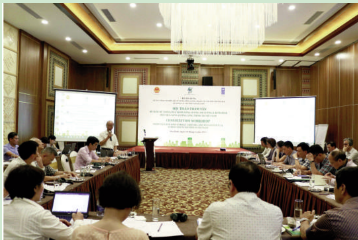
Toàn cảnh Hội thảo