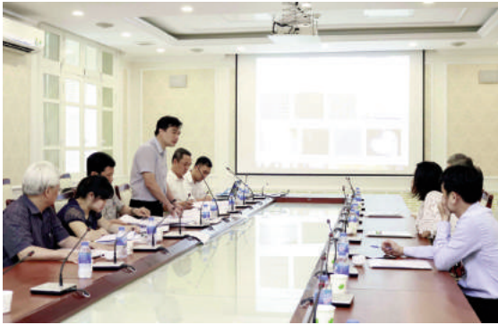
Toàn cảnh buổi nghiệm thu

nhiên, viên đá tự nhiên bó vữa ngoài trời được sử dụng phổ biến trong các công trình xây dựng, đường giao thông. Hiện nay, hệ thống TCVN đã ban hành khá đầy đủ các tiêu chuẩn về đá ốp lát tự nhiên và nhân tạo, song chưa có tiêu chuẩn để làm căn cứ xác định tính chất, chất lượng sản phẩm đá ốp lát ngoài trời và đá tự nhiên bó vữa ngoài trời. Vì vậy việc xây dựng 2 tiêu chuẩn này là cần thiết nhằm thống nhất cách xác định giữa các đơn vị sản xuất, phòng thí nghiệm và người tiêu dùng.