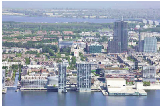
Almere – đô thị lấn biển của Hà Lan

Dân số gia tăng kéo theo một loạt vấn đề,