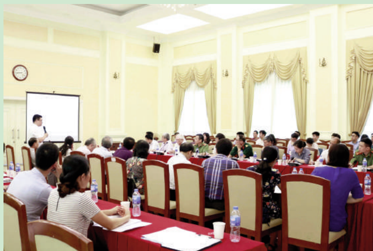
Các đại biểu dự Hội thảo