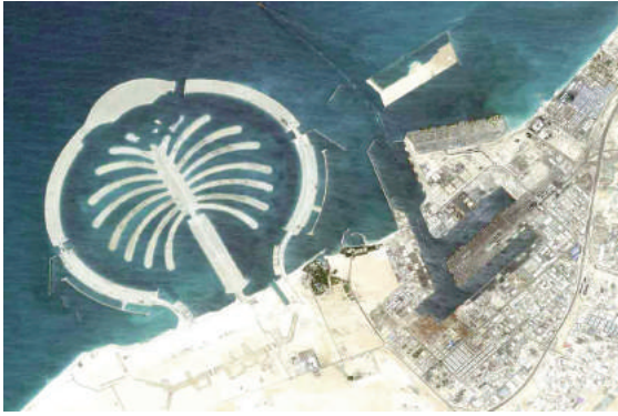
Palm Islands, UAE (ảnh chụp từ vệ tinh)

giảm thiểu những tác động tiêu cực đến đa dạng sinh học của các vùng duyên hải, và đơn giản hóa quy trình thi công.