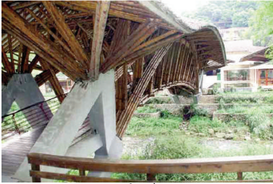
Một tác phẩm bằng tre của Simon Velez – “Crosswaters”

thành một vật liệu kết cấu lý tưởng tại các khu vực hay xảy ra động đất. Trong bối cảnh khủng hoảng môi trường toàn cầu hiện nay, và xét từ góc độ những vật liệu xây dựng truyền thống, thì chắc chắn tre là một trong những loại vật liệu triển vọng của tương lai.